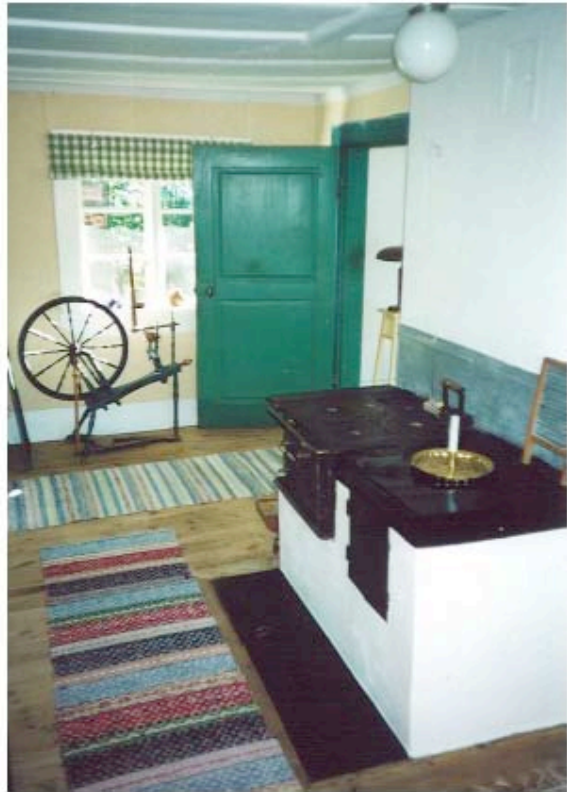
Efter | Övervåningen - tidstypiskt renoverat med varsam hand.